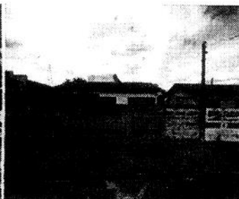
foto fachada do imóvel

A Secretaria da Fazenda notifica V.Sa. que através da foto aérea captada em agosto de 2018, devidamente auxiliada por software de geoprocessamento, detectou-se que o imóvel de sua propriedade apresentou divergência relacionada à metragem da área construída e/ou uso/padrão em comparação às informações constantes no cadastro imobiliário. Desta forma, nos termos dos artigos 145 e 149 do Código Tributário Nacional - CTN, segue boleto contendo o valor do lançamento complementar de IPTU/Taxa 2019 para pagamento à vista com desconto de 5%. O contribuinte tem até a data de vencimento do boleto para contestar sobre o lançamento. Após este prazo, as multas e juros devidos serão cobrados.