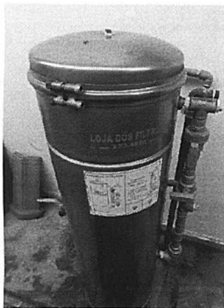
Fotos depois da manutenção